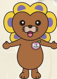
中原区社協 マスコットキャラクター 「中原パルるん」

「であい、ふれあい、ささえあい」をテーマに 福祉や健康にかかわる区内約50団体が参加